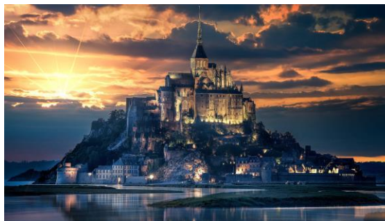
01~04 聖米歇爾山 水彩 4 開 (日期：3/5、3/12、3/19、3/26，學費：$1,600)