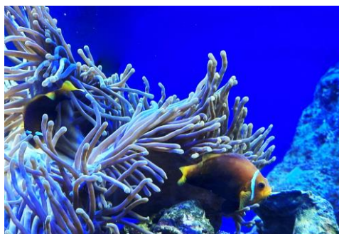
10~12 海底珊瑚礁_水彩 8 開 (日期：5/7、5/14、5/21，學費：$1,200)

游藝社幹事：廖慧如，Nereid.Liao@twgrid.org，電話：2789-8373