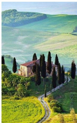
05~06 托斯卡納_水彩 8 開 (日期：4/2、4/9，學費：$800)