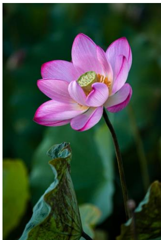
07~09 翩翩不盡風前態_水彩 8 開 (日期：4/16、4/23、4/30，學費：$1,200)