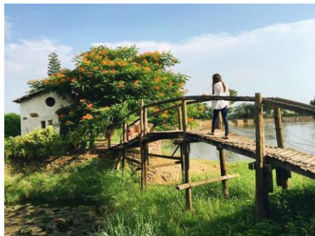
07~09 台南市的老塘湖藝術村(橋)_水彩 8 開 (日期：5/23、5/30、6/6，學費：$1,200)