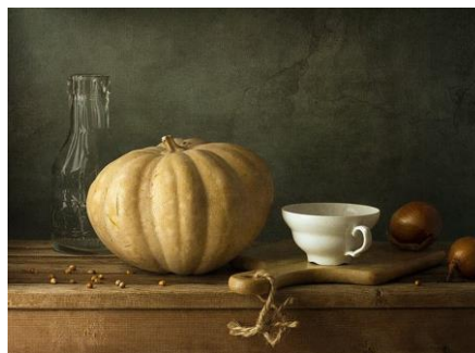
10~12 有南瓜的靜物_水彩 8 開 (日期：6/13、6/20、6/27，學費：$1,200)

游藝社幹事：廖慧如，Nereid.Liao@twgrid.org，電話：2789-8373