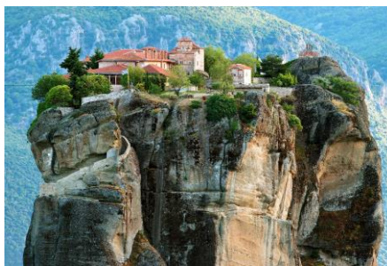
04~06 希臘的修道院_邁泰奧拉_水彩 8 開 (日期：5/2、5/9、5/16，學費：$1,200)