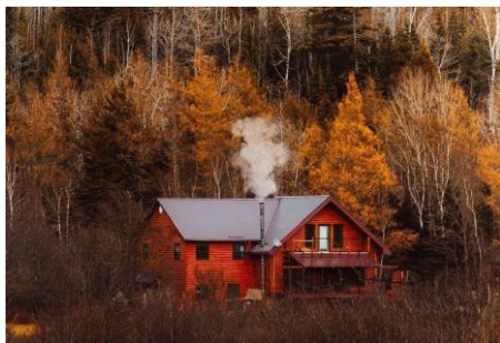
01~03 加拿大的秋天_水彩 8 開 (日期：4/11、4/18、4/25，學費：$1,200)