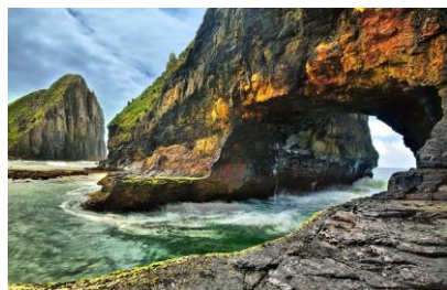
07~09 南非咖啡灣，東開普省的狂野海岸附近，牆洞_水彩 8 開 (日期：10/18、10/25、11/1，學費：$1,200)