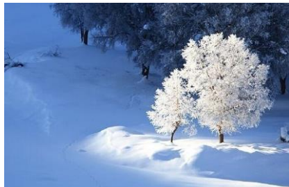
01~03 新疆維吾爾的鞏乃斯冬景_水彩 8 開 (日期：9/6、9/13、9/20，學費：$1,200)