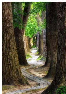
04~06 北市北投二子坪步道_水彩 8 開 (日期：9/27、10/4、10/11，學費：$1,200)