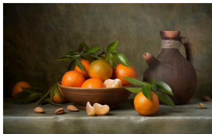
10~12 有橘子的靜物_水彩 8 開 (日期：11/8、11/15、11/22，學費：$1,200)

游藝社幹事：廖慧如，neridliao@gmail.com，電話：2789-8373