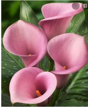
07~09 彩色海芋_水彩 8 開