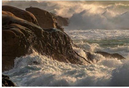
04~06 野柳&龜吼_水彩 8 開