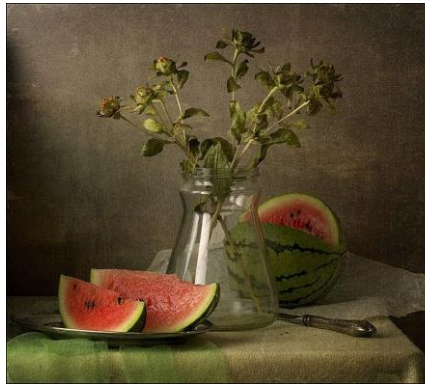
10~12 有西瓜的靜物_水彩 8 開

游藝社幹事：廖慧如，Nereid.Liao@twgrid.org，電話：2789-8373