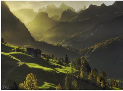
01~03 義北山景_水彩 8 開