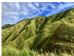
01~03 宜蘭礁溪~抹茶山(聖母山莊)_水彩 8 開