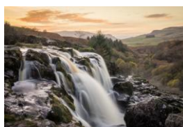
09~12 蘇格蘭_小瀑布_水彩 4 開