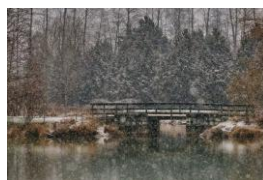
04~05 風雪飄零加拿大_水彩 8 開