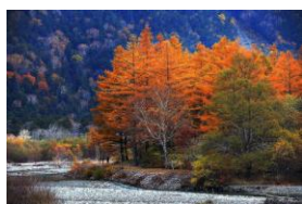
06~08 日本上高地風光_水彩 8 開