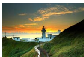
01~03 (2/18~3/3) 新北市鼻頭角步道_8 開