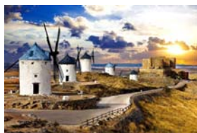
07~09 (3/31~4/14) 西班牙托雷多風車磨坊_8 開