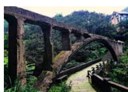
04~06 (3/10~3/24) 金瓜石水圳橋_8 開