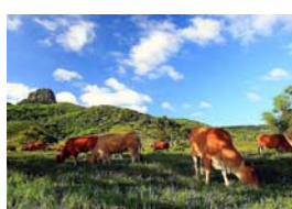
10~12 (4/21~5/5) 墾丁仲夏牧牛_4 開

游藝社幹事：廖慧如，Nereid.Liao@twgrid.org，電話：2789-8373