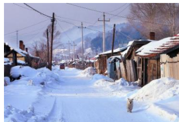
09~12 東北村莊雪景_4 開

游藝社幹事：廖慧如，Nereid.Liao@twgrid.org，電話：2789-8373