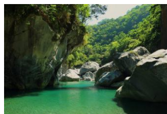
03~05 砂卡礑步道_8 開