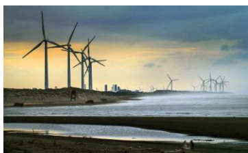
01~02 桃園/許厝港暮色_8 開