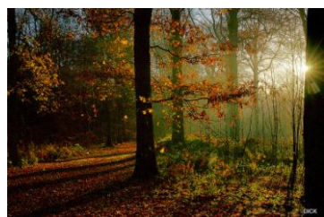
06~08 深秋季節_8 開