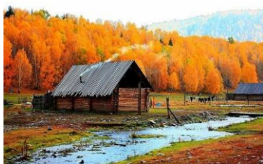
07~09 北疆喀那斯深秋（預計 6/4~6/18）