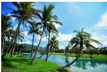
01~03 花蓮雲山水（預計 4/23~5/7）