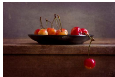
10~12 櫻桃一碟_Ana Nemoy (6/25~7/9)

游藝社幹事：廖慧如，Nereid.Liao@twgrid.org，電話：2789-8373