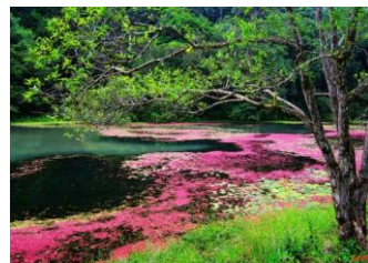
04~06 福山的初秋（預計 5/14~5/28）