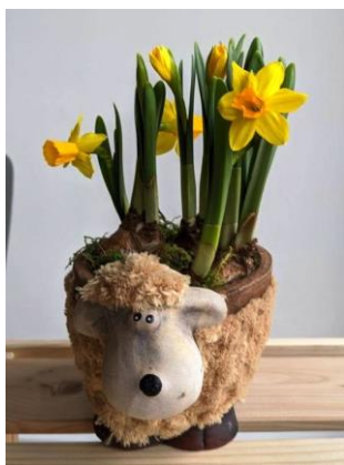
07~09 洋水仙_水彩 8 開 (日期：7/11 起，學費：$1,200)