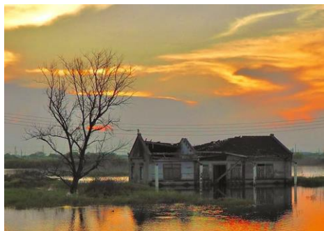
05~06 嘉義東石水上古屋日出_水彩 8 開 (日期：7/11 起，學費：$800)