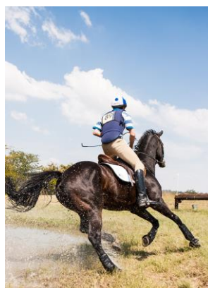
10~12 馬術-jean van der meulen_水彩 8 開 (日期：7/11 起，學費：$1,200)

游藝社幹事：廖慧如，Nereid.Liao@twgrid.org，電話：2789-8373