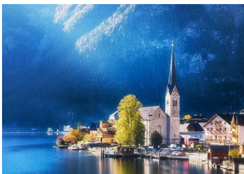
01~04 奧地利小鎮哈爾斯塔特_水彩 4 開 (日期：7/11 起，學費：$1,600)