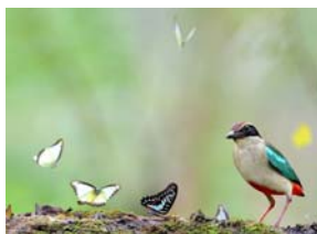
01~03 八色舞蝶_水彩 8K3