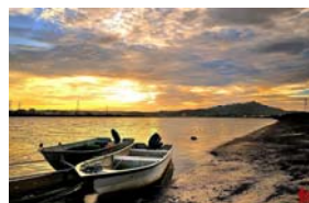
07~09 淡水河畔夕暮_水彩 8K4