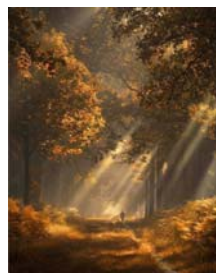
04~06 秋天的陽光_水彩 8K5